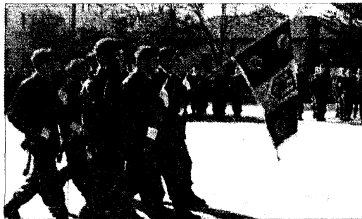
Garda de onoare aduce drapelul școlii