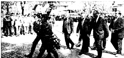
Coroane de flori în memoria eroilor tanchiști