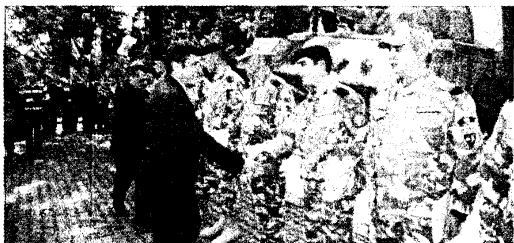
Diplome acordate militarilor