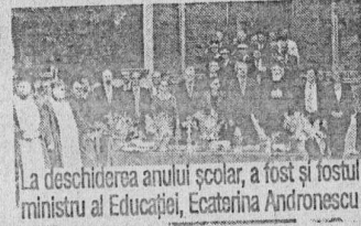
La deschiderea anului școlar, a fost și fostul ministru al Educației, Ecaterina Andronescu