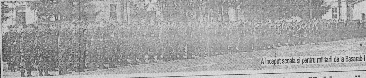
A început școala și pentru militarii de la Basarab I

marea de bază încep din sînul familiei, de unde copiii trebuie să înțeleagă și să se obișnuiască cu dimensiunea educației; aceasta se consolidează ulterior, în mod organizat, în școală și continuă toată viața în relațiile interumane. Pentru toate aceste motive, cu toții avem datoria să ne îndeplinim misiunea și să sprijinim prin toate mijloacele crearea viitoarelor personalități și viitorii performeri ai României. Pentru a atînge acest scop, voi, dragi elevi, o puteți face doar prin ascultare, muncă și receptivitatea de a învăța din știința dascălilor voștri, ca să creșteți frumoși și înțelepți. Pe de altă parte, dumneavoastră, stimat profesori, aveți pe umeri responsabilitatea de a lumina mințile și de a insufla sensibilitate în sufletul tinerilor aflați pe băncile școlii și de