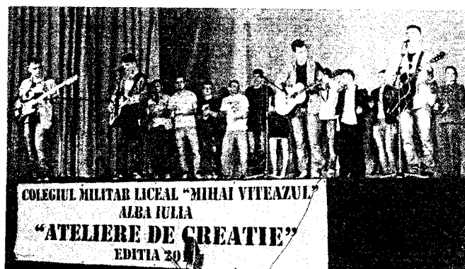
COLEGIUL MILITAR LICEAL „MIHAI VITEAZUL” ALBA IULIA „ATELIERE DE CREAȚIE” EDITIA 2014

prin imaginație făcuți cu sinceritate, candoare juvenilă. În acest periplu al artelor frumoase se deschid porți spre cultură, ferestre spre frumos, căile către filiațiile unei lumi sensibile, o adevărată floare a darurilor, grație gândului exprimat frumos, cizelat, a responsabilității față de componența criptică a vârstei pe care ci o reprezintă și pe care ne-o revelează cu fiecare vers cristalin, cu fiecare frază. E un ceremonial și un act investit cu funcția esențială a celebrării arter: pictura fa slujit pe zei, poezia lea-a dat glas, dansul fa venerat și lea-a geometrizat formele la nivel ideal, muzica a deschis drumul spre armonie și frumusetate.